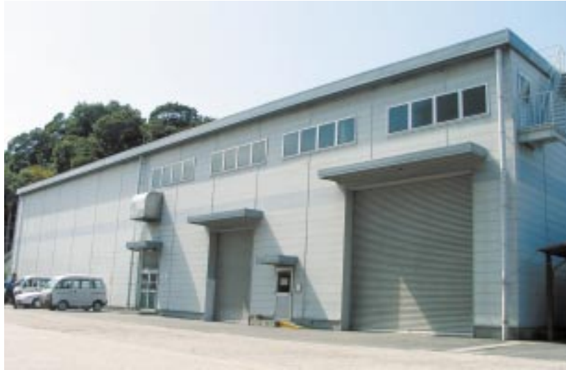
安来工場 新素材センター ターゲット材工場