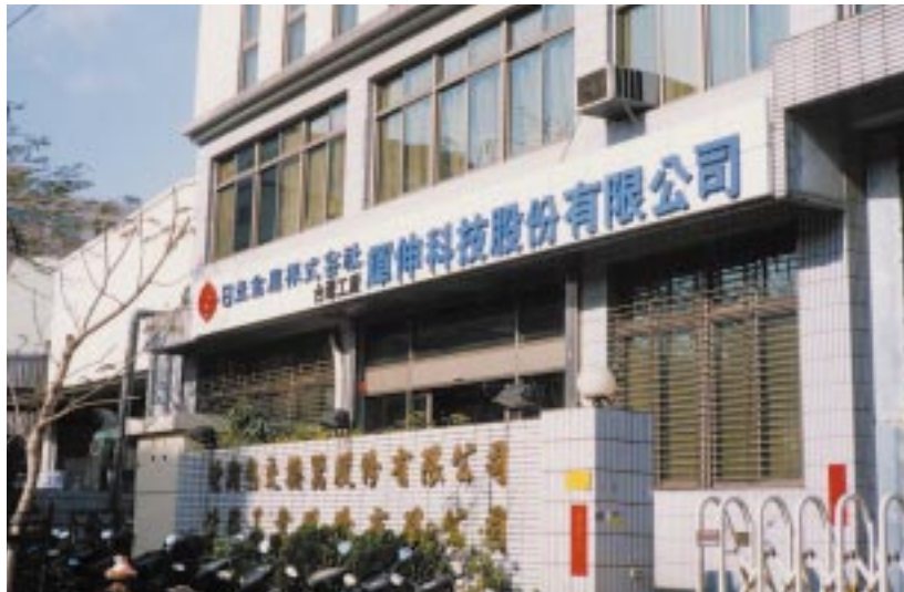
輝伸科技股份有限公司(台湾)